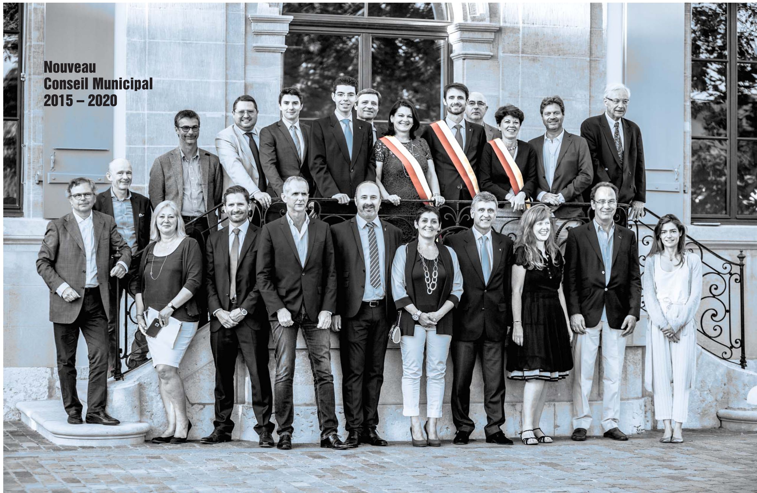
Nouveau Conseil Municipal 2015 – 2020