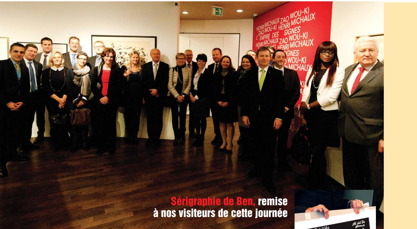
Sérigraphie de Ben, remise à nos visiteurs de cette journée