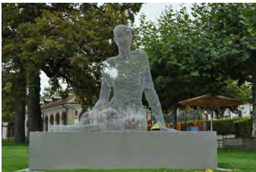
Femme assise de Cédric Le Borgne