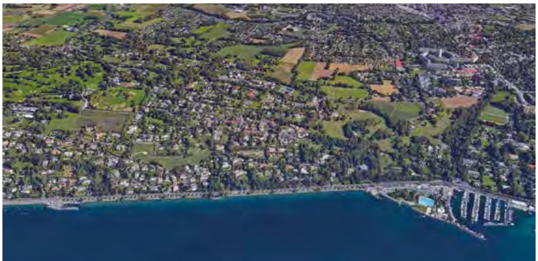
Vue aérienne de la commune de Cologny