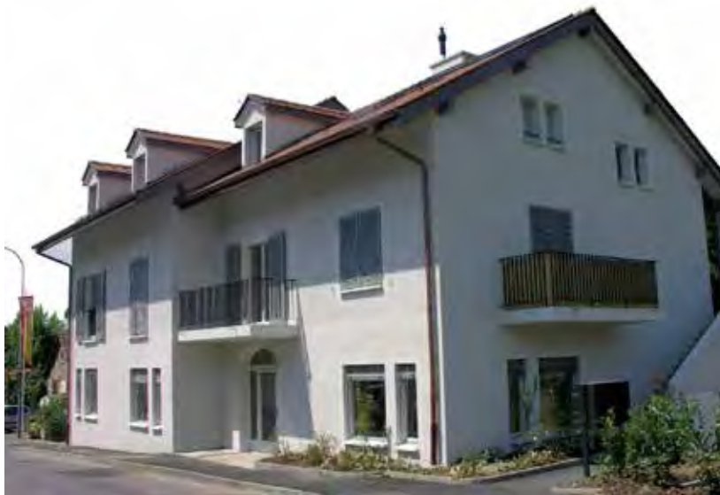
Etat civil «Arrondissement Campagne et rive gauche du Lac»

Chemin des Rayes 3 - 1222 Vézenaz - 022.722.11.80