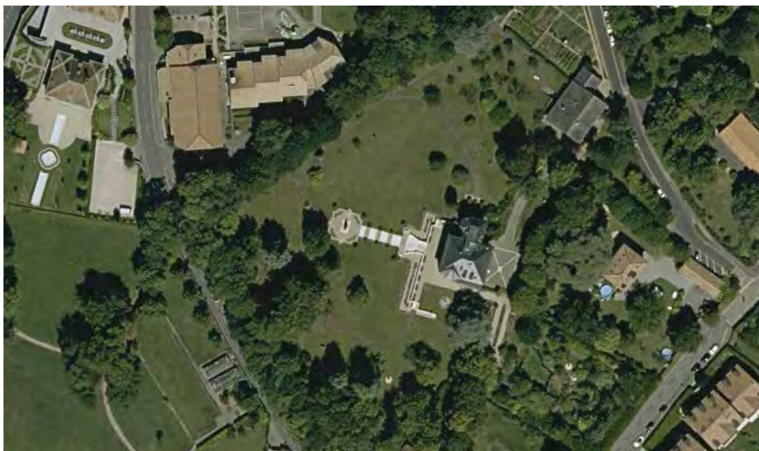
Parcelle chemin des Fours 16