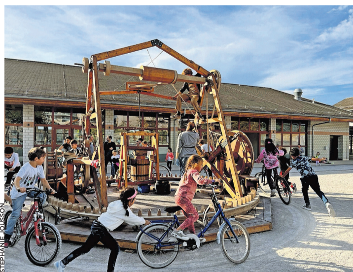
L'ingénieux pressoir label-Vie en plein exercice.

Sans discrimination aucune, les fruits apportés, une fois rincés et coupés en deux, sont passés par le broyeur qu'active de ses muscles un joyeux mélange d'enfants et d'adultes. Leur transformation se poursuit dans le tonneau central, muni d'un grand filtre de tissu. Là, une presse descend, grâce à des rouages activés par des cyclistes, laissant apparaître en bout de course le nectar délicieux. Celui-ci passera encore par une dame-jeanne et un dernier filtrage avant de terminer dans les bouteilles mises à disposition par l'association label-Vie et offertes par la Mairie.