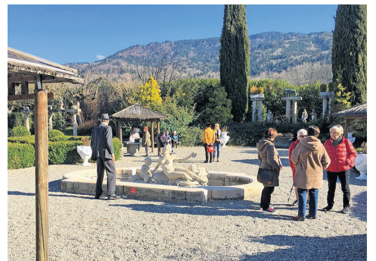
Le groupe de loisirs au château d'Avully.