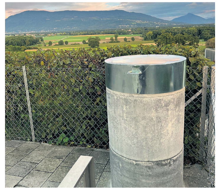
Le pilier se situe au coin du parking du cimetière de Choulex. OLIVIER LOMBARD

Et la dernière utilité de ce «monument» communal concerne l'altimétrie. Son altitude a été très précisément calculée. Sous son couvercle de métal se trouve une embase pour pouvoir fixer une antenne ou des instruments de géomètres. À Choulex, on sait désormais où l'on se trouve!