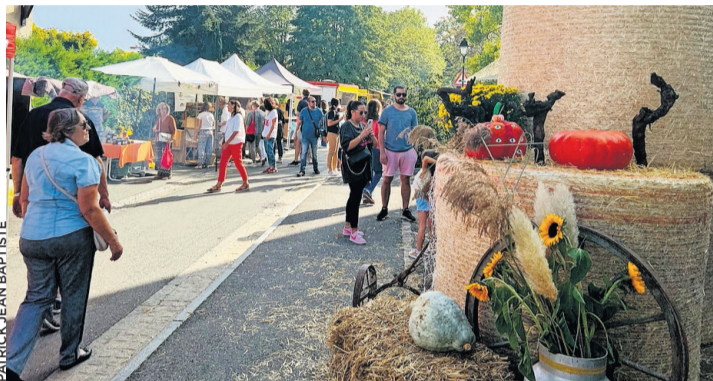
La Fête de la courge dans les rues du village en 2023.

Au programme: mot de bienvenue des autorités communales à 11h sur la place de la Poste, des