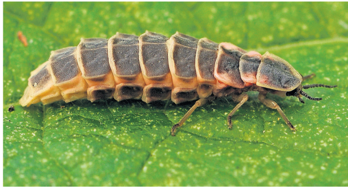
Spécimen d'un «Lampyrus noctiluca», ou plus communément appelé ver luisant.

Le lampyre, après avoir passé deux ans sous forme de larve et au crépuscule de sa vie, devient enfin