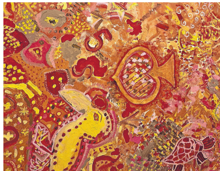
Détail d'une œuvre collective réalisée par les habitués du foyer de jour. Stéphanie Jousson

Toutes les informations pratiques se trouvent sur le site aux5colosses.ch ou en appelant le 022 347 01 20.