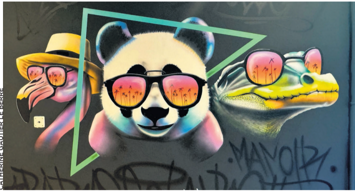
Détail de la fresque de Yoan pour les écoliers du Manoir.

Le joli bâtiment, dont les plans ont été dessinés par le bureau d'architectes Christian Dupraz Architecture Office, est fait de bois de hêtre simple et sobre. Le préau sera finalisé sur le toit et un nouveau préau sera créé dans le pré-