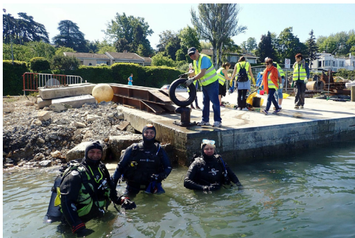
Les plongeurs du club Mora Mora s'unissent aux bénévoles à terre pour soulager le Léman des déchets qui s'y trouvent.