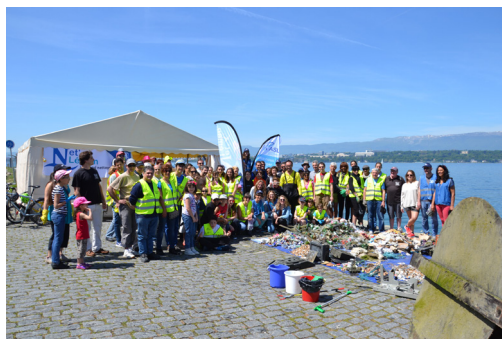
En 2016, plus de 615 Kg de déchets ont été repêchés sur le Quai de Cologny.

Toutes les informations utiles se trouvent sur : http://www.netleman.ch/infos-pratiques/ .