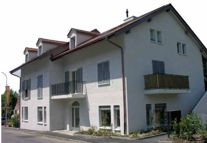
Etat civil «Arrondissement Campagne et rive gauche du Lac» Chemin des Rayes 3 - 1222 Vézenaz - T.022.722.11.80